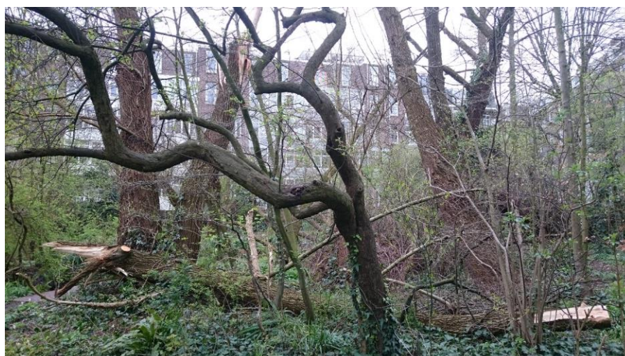
De afgezaagde grote tak op de grond.