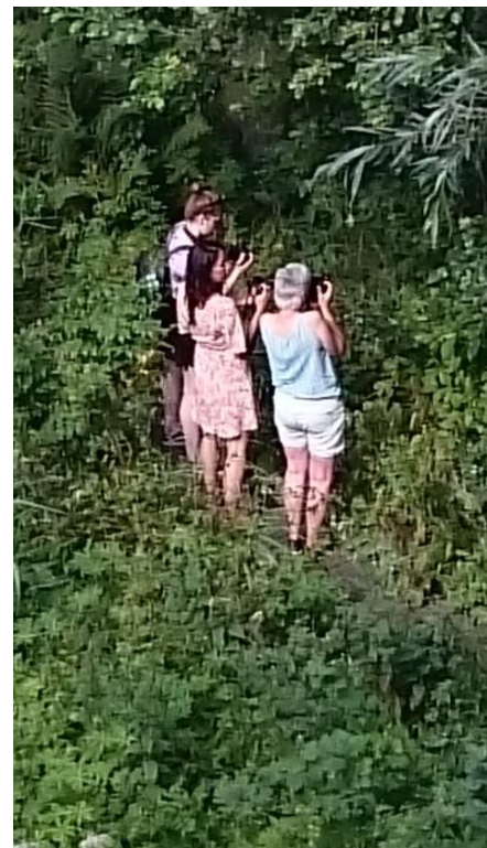
Fotoworkshop in de Slatuinen

Op zaterdag 12 september werd er weer een fotoworkshop gehouden. Het was nog net warm genoeg om voor de theorie buiten te kunnen zitten. Wel zo veilig, want het aantal corona besmettingen begon weer op te lopen.