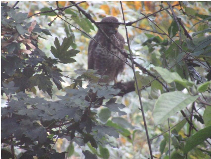
Een buizerd (Buteo buteo) jaagt gebruikelijk in open land, maar werd in de herfst van 2020 driemaal gespot in de Slatuinen!

Met een blik op de eindbalans 2020 kunnen we, ondanks het vast nog lastige jaar 2021, met vertrouwen de toekomst van de Slatuinen tegemoetzien: als een bijzonder stukje stadsnatuur, als aangename ontmoetingsplek en als plek voor natuureducatie.