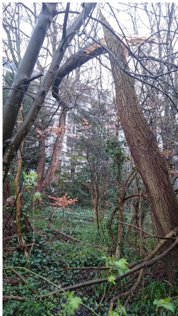
De geknakte wilg ten gevolge van de storm.

Op zondag 9 februari trok er voor het eerst een storm met een naam door Nederland: Ciara. Qua stormkracht was deze dame geormerkt met code oranje, hetgeen inhield dat men met zeer zware windstoten tot zeker 100 kilometer per uur moest rekenen. De Slatuinen hielden we gesloten omdat we het onder deze omstandigheden onverantwoord achtten bezoekers in de tuin toe te laten. Dat bleek geen onjuiste inschatting. Een wilg brak nagenoeg doormidden waarbij het gebroken deel op de takken van een andere boom tot stilstand kwam. Naderhand is deze grote tak door (het team van) de boomtaxateur omwille van de veiligheid van de boom verwijderd.