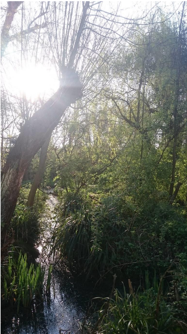
De Slatuinen in de ochtendlijke lentezon