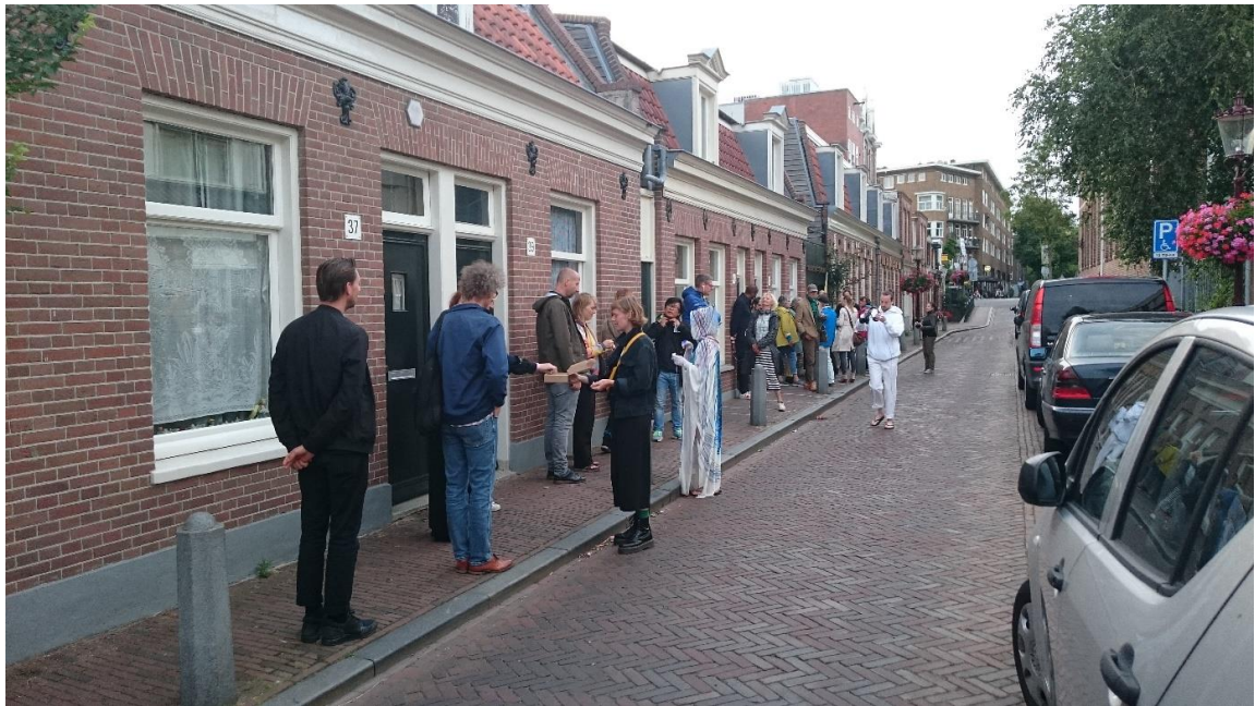
Vrijdagmiddag 3 juli: buurtbewoners in de rij voor de Off Venue audiotour.