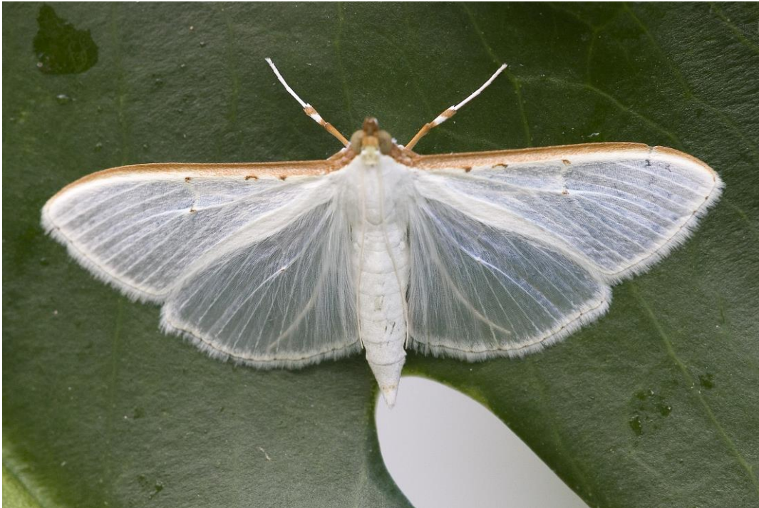
De zeer zeldzame Palpita vitrealis (satijnlichtmot)

Hoogtepunten waren de satijnlichtmot, een zeer zeldzame nachtvlinder die maar eenmaal eerder in Amsterdam is waargenomen, en de groene krabspin die normaliter bewoner is van oude loofbossen.