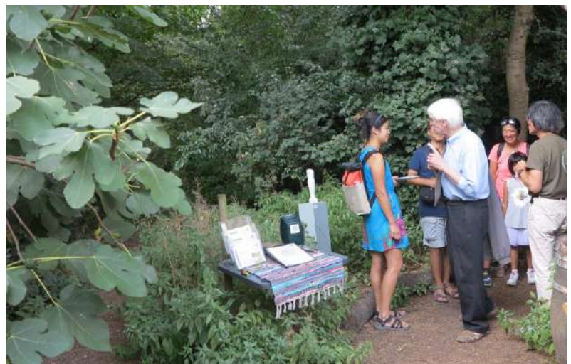
Bezoekers tijdens het feest.

Op zondagmiddag 4 september vierde de Natuurtuin Slatuinen het dertigjarig jubileumfeest met omwonenden, andere genodigden en ook bezoekers, want de tuin was gewoon open. Twee IVN vrijwilligers hadden een standje met informatie vlak bij de doorgang en er was een beeldtentoonstelling in de tuin van Lidy Beemster. Men kon zich te goed doen aan een gevarieerde dis van warme, hartige en zoete hapjes en aan fruit en drank, ingekocht en bereid door de vrijwilligers van de tuin. Men kon meer over de tuin te weten komen door zich bij een rondleiding aan te sluiten. Het was bijzonder gezellig op deze heerlijke, zonnige dag.