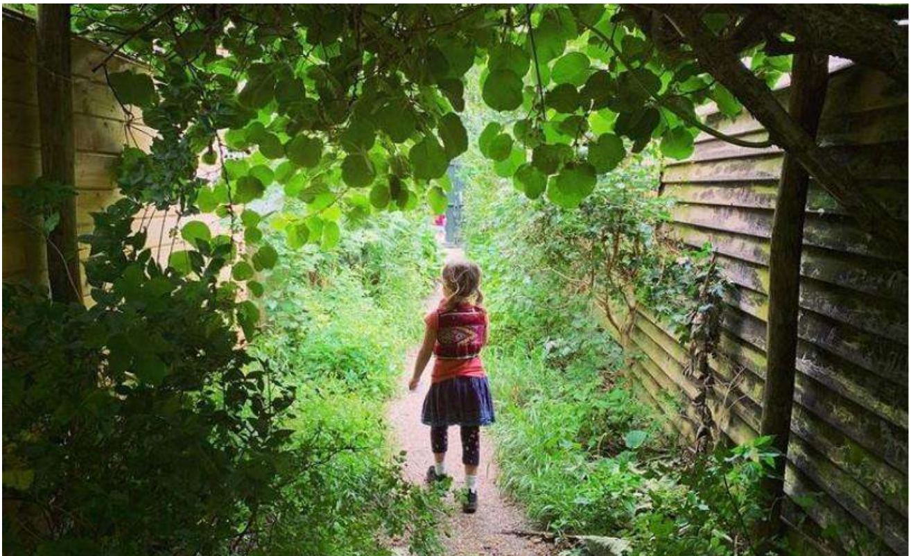
Foto van de doorgang in de Slatuinen, uit het artikel 8x verstopte plekje in Amsterdam, in de online krant https://indebuurt.nl/amsterdam .

Een 'verborgen paradijsje' wordt het wel genoemd: Natuurtuin 'De Slatuinen'. Naast grote bonte spechten, esdoorns en zwartmoeskervel vinden midden in het stadsdeel De Baarsjes nog talloze andere soorten bloemen, planten, vogels en kleine zoogdieren hier een rustige plek. Een bijzondere plek, die ook op een bijzondere manier wordt beheerd, namelijk door bewoners uit de buurt.