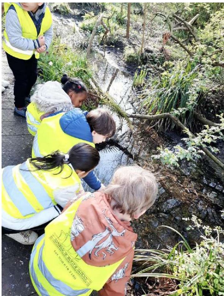
De eerste lentelessen in de Slatuinen..