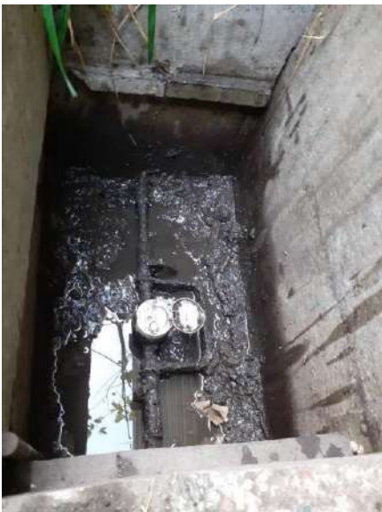
De leeggeschepte put.

Zou het ons lukken om het lek op te sporen? Of toch maar wachten op de beschikbaarheid van professionele hulp? De leiding lag namelijk diep, zo diep als in de put. Maar langere tijd zonder direct beschikbaar water in keuken en toilet is toch wel ongemakkelijk en oncomfortabel. Bovendien, als het ging vriezen zou de situatie zich kunnen verergeren. En zo geschiedde dat op donderdag 1 december nagenoeg alle Slatuinse weerbare mannen tot 94 jaar en een enkele weerbare vrouw bij elkaar kwamen in de doorgang om bij toerbeurt te spitten naar het lek, om grond, planten en struiken te verplaatsen dan wel anderszins ondersteuning te bieden. Het spitwerk was zwaarder dan gedacht, want we stuitten regelmatig op stenen in de grond. Groot was dan ook de vreugde toen we nog dezelfde dag het lek vonden: er zat een scheur in de (waarschijnlijk polyethyleen) waterleiding. Met een 'tussenstuk' van de naburige ijzerhandel konden we het lek repareren.