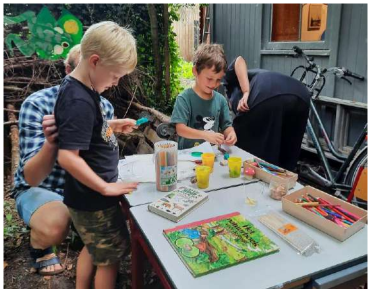
Kinderactiviteit tijdens het feest.