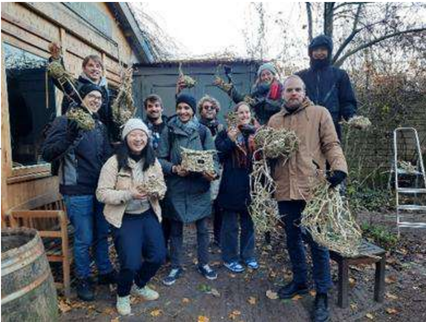
Studenten van de Academie van de Bouwkunst, gereed om de nestkastjes op te hangen.