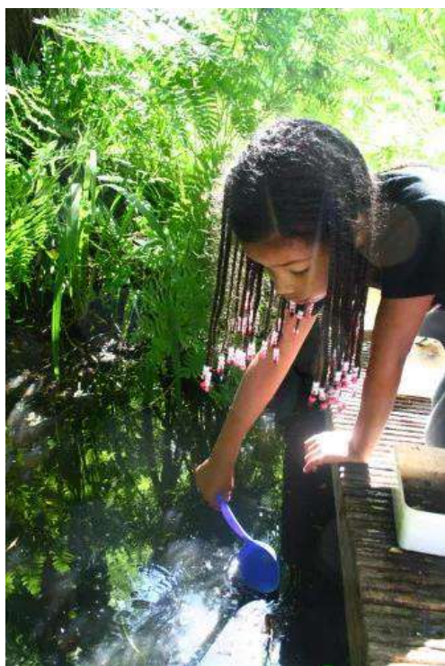
Waterdierjes uit de vijver scheppend.