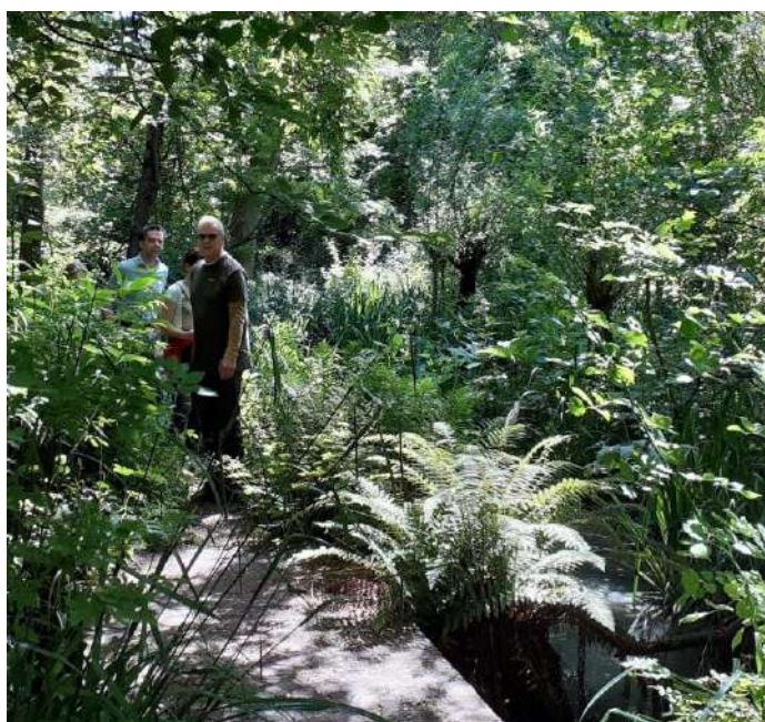
De tuin tijdens Open Tuinen West, een wilde groene oase.

Het was vrij zonnig en warm op deze derde editie van Open Tuinen West, gehouden op zaterdag 11 juni. Het tentdoek ter overspanning tegen het Slatuinhuis aan hoefde niet opgezet te worden. Al wandelend op eigen gelegenheid kon men de tuin bezoeken of men kon zich aansluiten bij een rondleiding van ca. 20 minuten op het hele en halve uur. De tuin werd bezocht door zo'n 350 tuinliefhebbers. Er hing een prettige sfeer die mede werd opgeluisterd door de catering voor koffie, thee, frisdrank en een appelpunt. Met name tussen de middag werd het een gezellige drukte bij het Slatuinhuis, toen men ook een broodje kaas of een tosti kaas kon nemen.