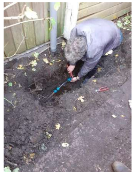
Reparatie van het lek.