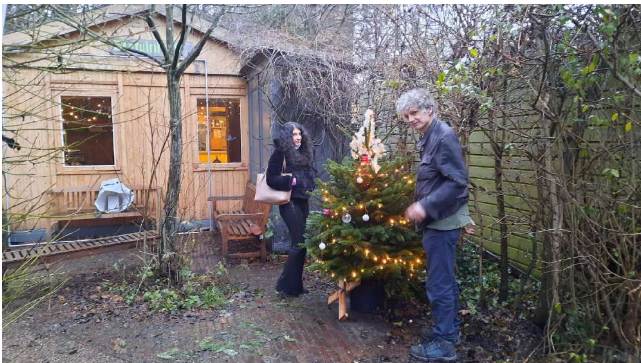
Ook open op zondag 1 e Kerstdag, met bijpassende versiering.