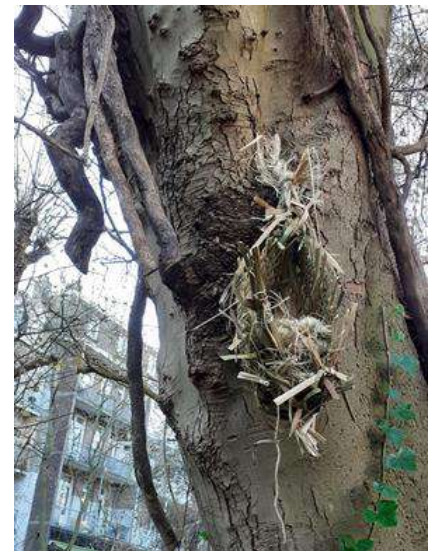
Een van de nestkastjes.