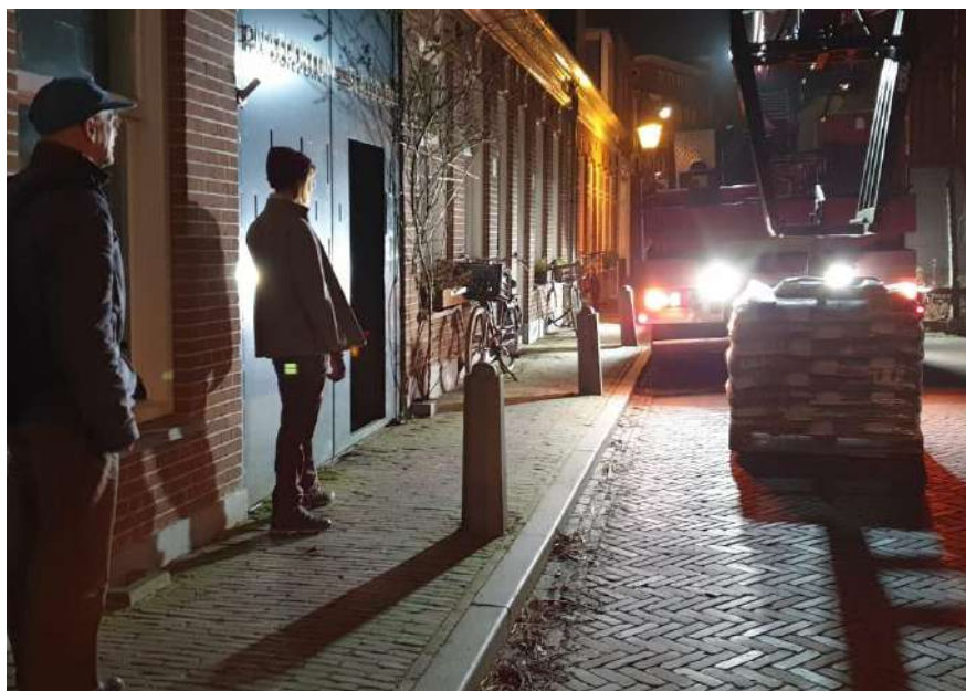
Woensdagmorgen 2 februari: voor dag en dauw op voor de aflevering van zakken met schelpen voor de tuinpaden.