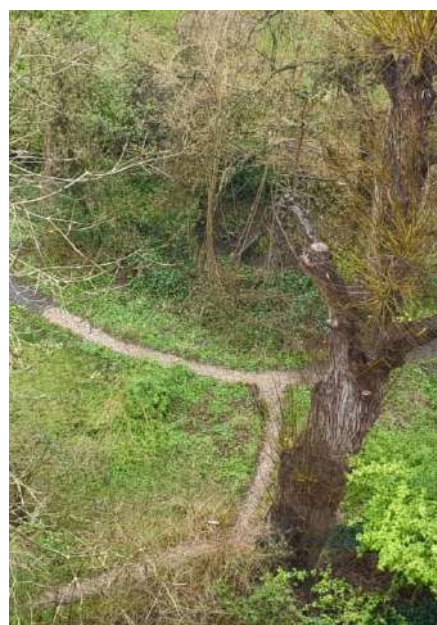
De Natuurtuin Slatuinen vanaf een zolderkamer aan de Jacob van Wassenaer Obdamstraat. Het is eind maart, de deels met een nieuwe schelpenlaag bedekte paden zijn nog duidelijk zichtbaar.