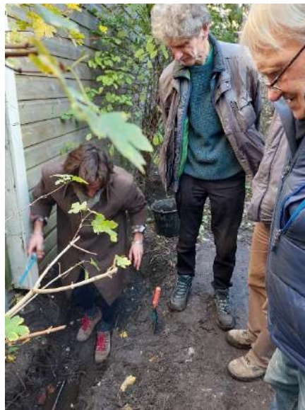
Het lek gevonden!